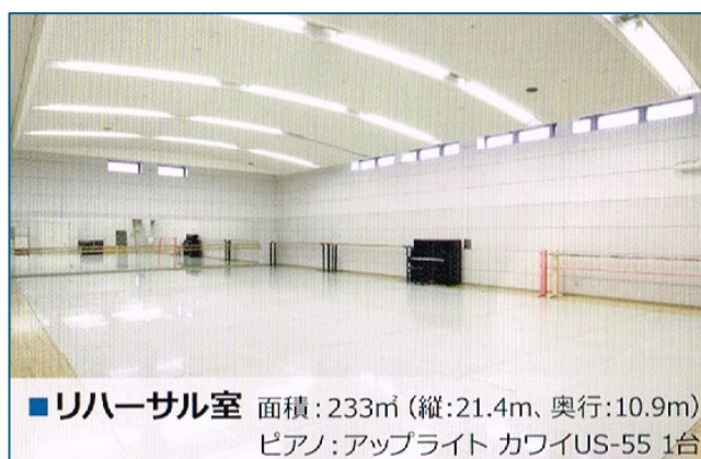
■ リハーサル室 面積: 233㎡ (縦: 21.4m、奥行: 10.9m) ピアノ: アップライト カワイUS-55 1台